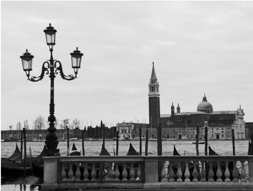
Canal grande, Venezia