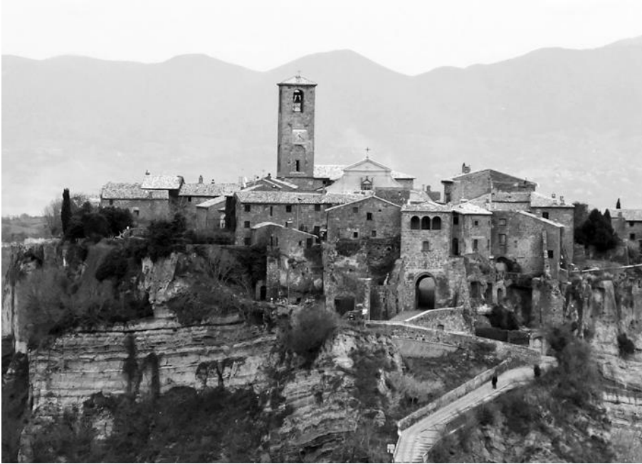
civita di bagnoregio